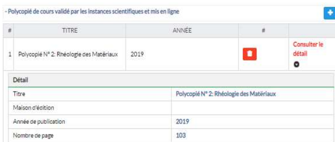
Figure -(16)- détails d'une activité pédagogique

Le bouton voir le détail permet d'afficher un résumé des informations introduites (figure 16).