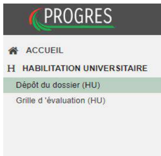
Figure -(1)- Accès a la fonction Dépôt de dossier (HU)

La figure (2) présente l'onglet principal du dépôt de dossier d'habilitation universitaire.