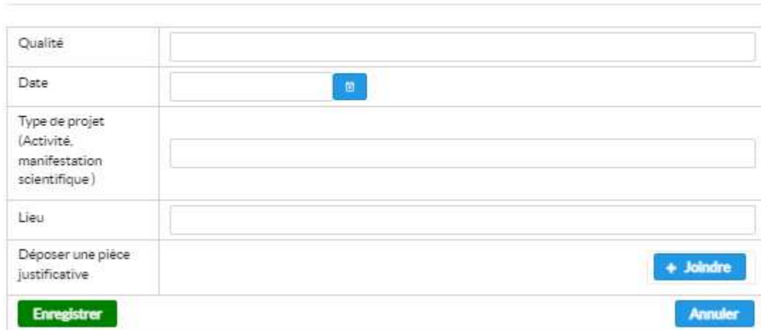
Figure -(25)- Ajout d'une participation a l'organisation de manifestation scientifique