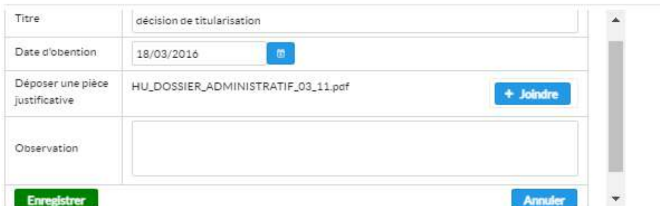
Figure -(7)- fenêtre de jointure d'une pièce du dossier

Sur la fenêtre d'ajout de la pièce, il faut renseigner le titre de la pièce, la date d'obtention , joindre le document en cliquant sur le bouton + joindre , ajouter une observation si nécessaire puis cliquer sur enregistrer pour valider l'ajout de la pièce constitutive.