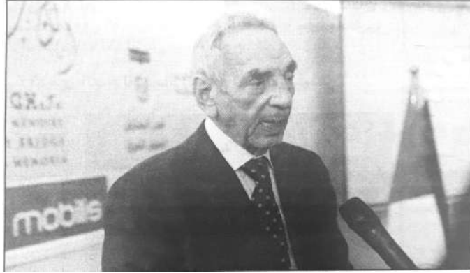
كما ذكرت ديباجة الملتقى مؤلفات الراحل الدكتور عبد المالك مرتاض التي تناهز الثمانين مؤلفا علميا

ويتضمن الملتقى عديد المحاور في طليعتها محور حول منابع تشكل الفكر الإبداعي المرتاض، محور ثاني يسلط الضوء حول جهود عبد المالك مرتاض في حقول الدراسات الأدبية فضلا عن محور يتناول التأصيل النقدية لدى عبد المالك مرتاض في المشرق والمغرب، ومحور الرابع حول عبد المالك مرتاض والدراسات اللسانية العربية الحديثة، ومحور خامس وأخير يناقش الدراسات الوطنية والدولية حول نتاج عبد المالك مرتاض.