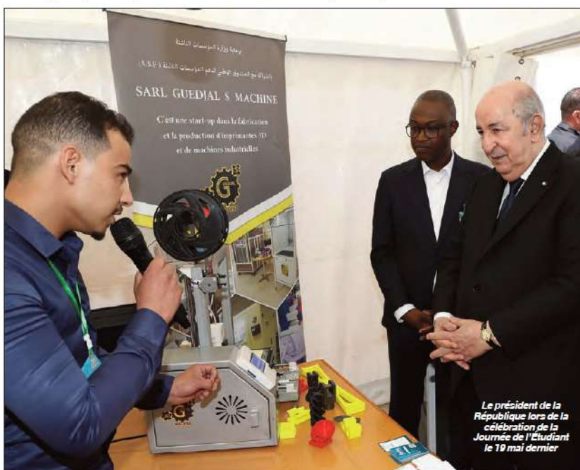
Le président de la République lors de la célébration de la Journée de l'Étudiant le 19 mai dernier

Ainsi, au 31 décembre 2023, pas moins de 324.506 jeunes ont été titularisés dans les entreprises et les